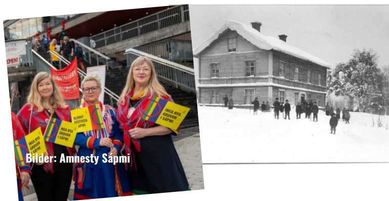
Bilder: Amnesty Sápmi