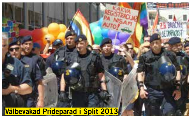
Välbevakad Prideparad i Split 2013

2010 hölls den första Pridemarschen någonsin i Litauens huvudstad Vilnius. Det var osäkert in i det sista om den skulle äga rum då riksåklagaren begärde att den skulle förbjudas med hänvisning till allmänhetens säkerhet. Dock segrade rätten till yttrandefrihet. Även här hölls marschen långt från allmänhetens ögon och fullt kravallutrustade poliser fanns utplacerade runt det avspärrade området. Men det faktum att marschen kunde hållas var ett framsteg i ett land så homofobiskt som Litauen.