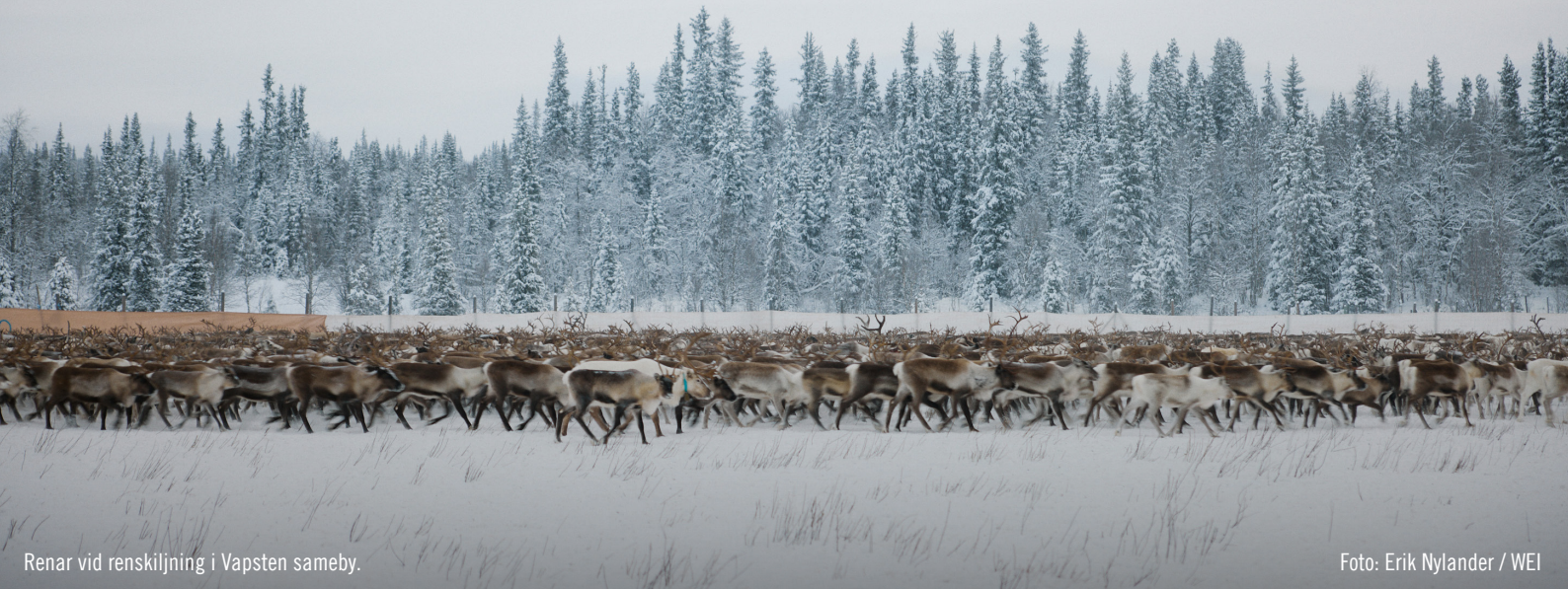
Renar vid renskiljning i Vapsten sameby.