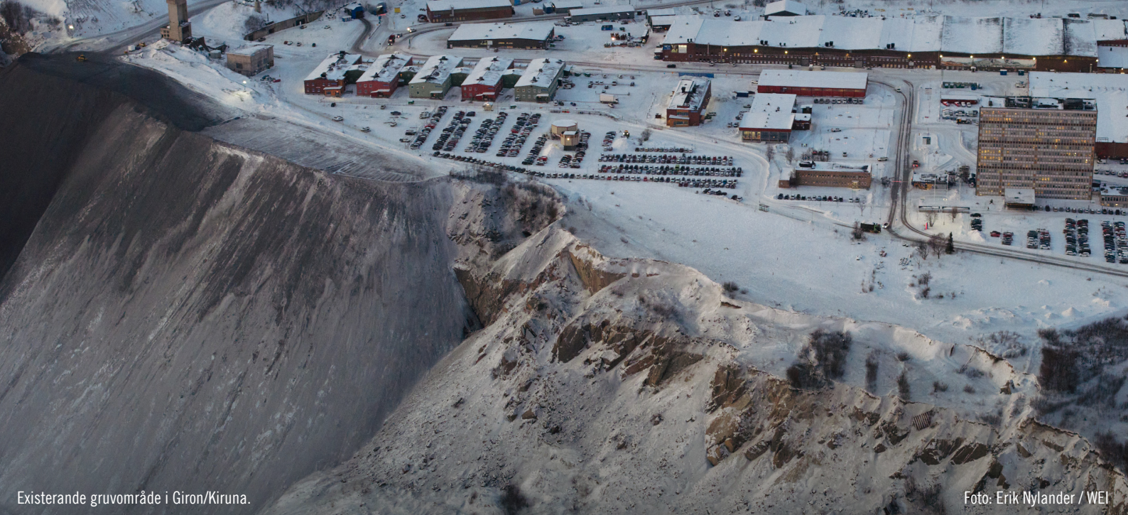
Existerande gruvområde i Giron/Kiruna.