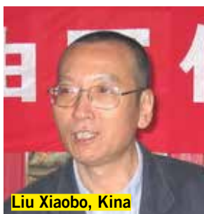
Liu Xiaobo, Kina