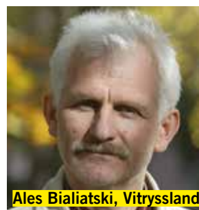
Ales Bialiatski, Vitryssland