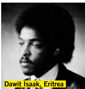
Dawit Isaak, Eritrea

Den information som finns om fallet är noggrant utarbetad av Amnestys utredare för att ge en så korrekt och bra bakgrund som möjligt. Amnesty gör egna utredningar på plats genom uppdragsresor men använder sig också av andra källor och lokala samarbetspartners. Det finns hundratals organisationer i världen som på olika sätt arbetar för mänskliga rättigheter. Många av dem har en agenda som sammanfaller med Amnestys, medan andra kanske inte har det. God kunskap om förhållanden i ett land och de olika maktstrukturer som finns krävs därför för att kunna bedöma vilka källor som är trovärdiga. Detta är särskilt viktigt när det idag är lätt att googla på ett namn och hitta information om den personen.