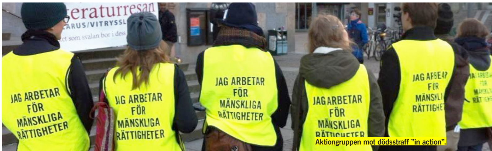
Aktionsgruppen mot dödsstraff "in action".