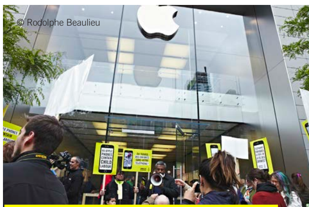
Aktion med Amnesty Internationals generalsekreterare Saliil Shetty utanför en applebutik i Montreal,

Den 19:e januari släppte Amnesty tillsammans med Afre-watch en rapport som spårar försäljningen av metallen kobolt. Den används i litium-jon batterier och utvinns ur gruvor där vuxna och barn, en del så unga som sju år, arbetar under farliga och skadliga förhållanden utan varken skyddskläder eller annan utrustning. Amnesty upptäckte att välkända märken som Apple, Samsung och Sony inte gör några grundläggande kontroller för att säkerställa att kobolt som bryts av barn inte återfinns i deras produkter.