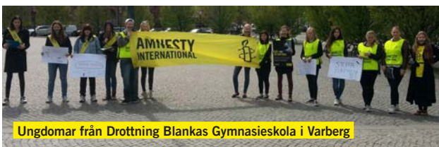
Ungdomar från Drottning Blankas Gymnasieskola i Varberg

Nu börjar terminen närma sig sitt slut och sommaren är på ingång! Bakom lämnar vi oss en termin av kampanjer för att förändra Tunisiens våldtäktslagstiftning och bekämpa den utbredda tortyren i Uzbekistan. Men att terminen tar slut betyder inte bara sommarlov för er Amnestyaktivister, det betyder också en del saker att tänka på, som vi här kommer påminna er om.