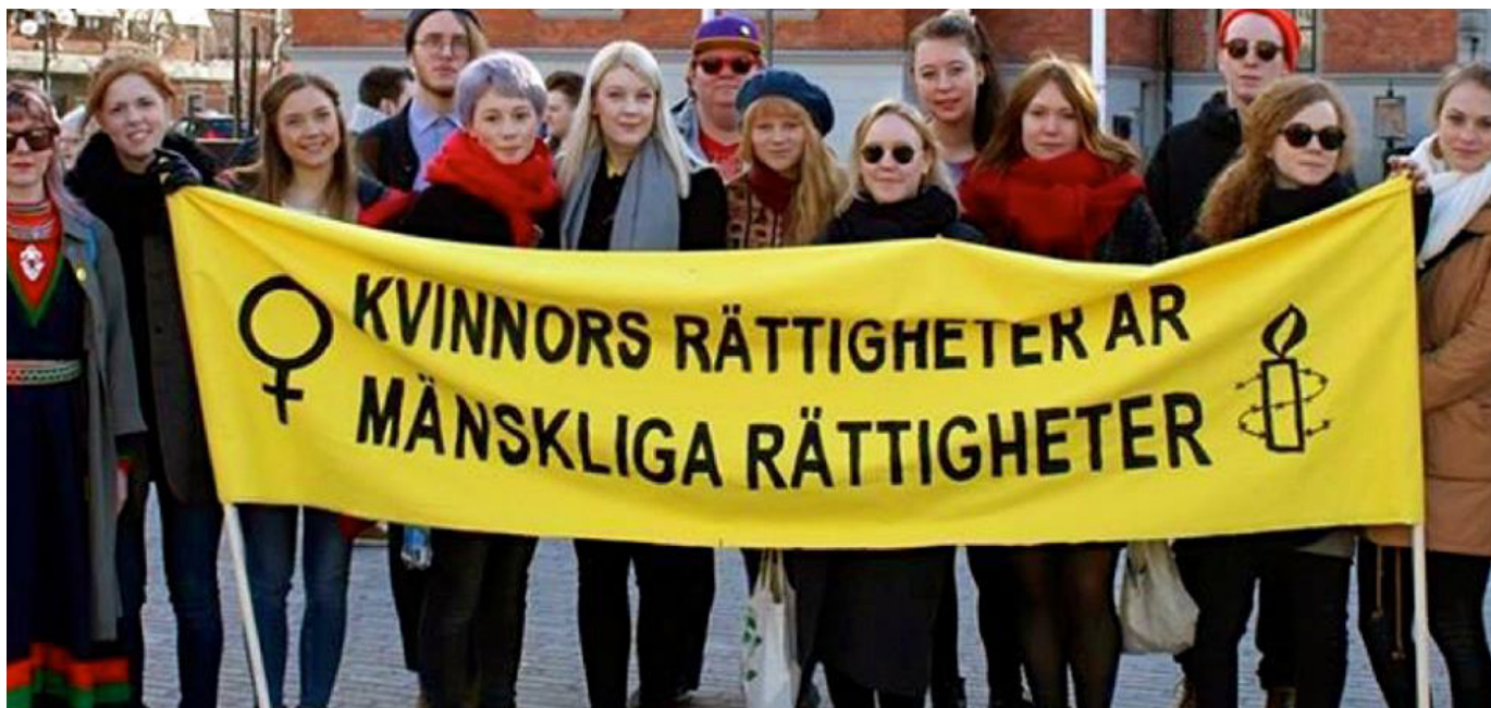
På Rådhusorget i Umeå, internationella dagen för kvinnors rättigheter 2015. Snart är det dags igen!