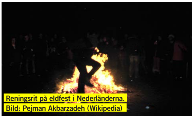
Reningsrit på eldfest i Nederländerna.

Det är en fest där olika privatpersoner och restauranger lagar mat och säljer. Vi är den enda organisationen där vilket gör att vi får bra uppmärksamhet och ingen konkurrens. Vi samarbetar tillsammans med en annan amnestygrupp och säljer en god persisk soppa som är populär och brukar ätas under slutet av vintern. Vi säljer också kaffe och te och informerar om Amnesty och vår grupp.