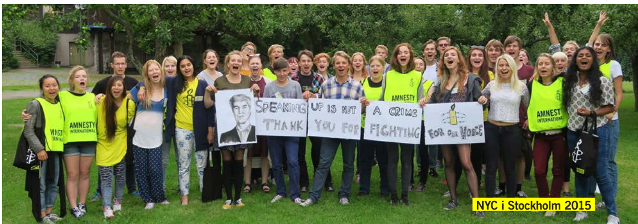
NYC i Stockholm 2015

Nu är det dags att ladda inför sommarens nordiska ungdomsmöte som i år kommer att vara strax utanför Helsingfors. Under träffen kommer ni lära er mer om Amnestys arbete, aktuella kampanjer, aktivism och ledarskap.