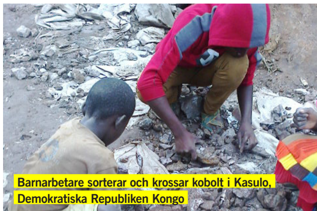
Barnarbetare sorterar och krossar kobolt i Kasulo, Demokratiska Republiken Kongo

Den 19:e januari släppte Amnesty tillsammans med Afrewatch en rapport som spårar försäljningen av kobolt, en metall som används i litium-jonbatterier. Kobolten bryts i gruvor där vuxna och barn, en del så unga som sju år, arbetar under farliga och skadliga förhållanden. Amnesty upptäckte att välkända märken som Apple, Samsung och Sony inte gör några grundläggande kontroller för att säkerställa att kobolt som bryts av barn inte återfinns i deras produkter.