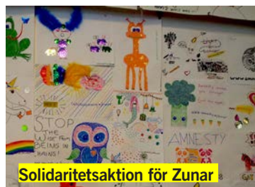
Solidaritetsaktion för Zunar

Vårens träff kommer bland annat att ta upp vår och sommarkampanjen som har fokus på hbtqi-rättigheter och att engagera fler i Amnesty.