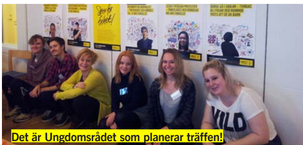
Det är Ungdomsrådet som planerar träffen!

“En nationell ungdomsträff är en helg då ungdomar från hela Sveriges samlas för att utbyta idéer och lära sig mer om Amnestys arbete och kampanjer. Helgen innehåller oftast en blandning av workshops, gruppdiskussioner, lekar och föreläsningar. Det är en chans att träffa nya engagerade människor och tillsammans inspirera varandra. De nationella ungdomsträffarna organiseras av ungdomsrådet och vi välkomnar alla att delta på vårens träff den 15-17 april. “