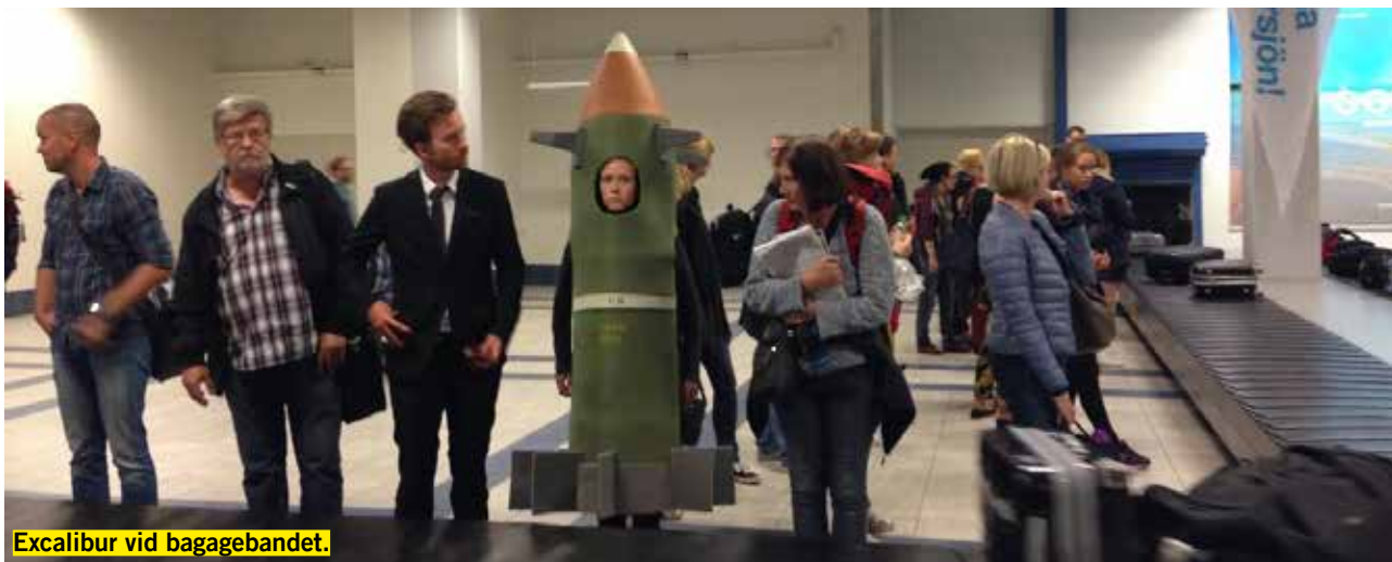
Excalibur vid bagagebandet.

KAMPANJSAMORDNARE / 08-729 02 69 / SUSANNA.WARHAMMAR@AMNESTY.SE