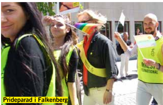
Prideparad i Falkenberg