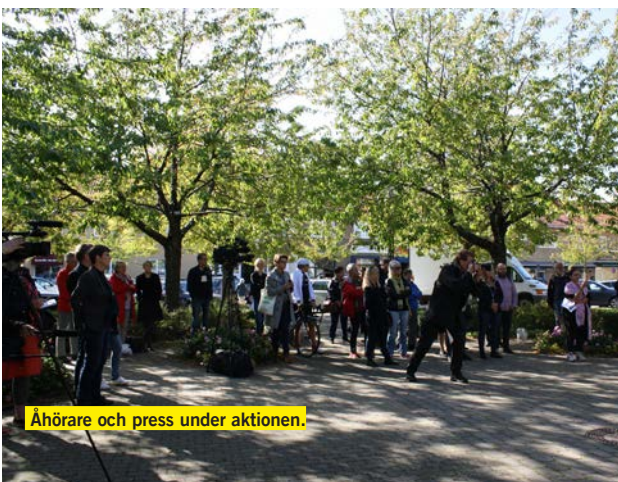
Åhörare och press under aktionen.

Manifestationen samlade minst ett sextiotal personer och massor av media. Kyrkoherden i Vellinge och jag pratade, och en romsk bulgarisk musiker spelade dragspel. Stämningen var positiv: massor av människor från Vellinge och övriga Skåne kom för att uttrycka sin uppskattning och sin frustration över de politiska tongångarna i kommunen.